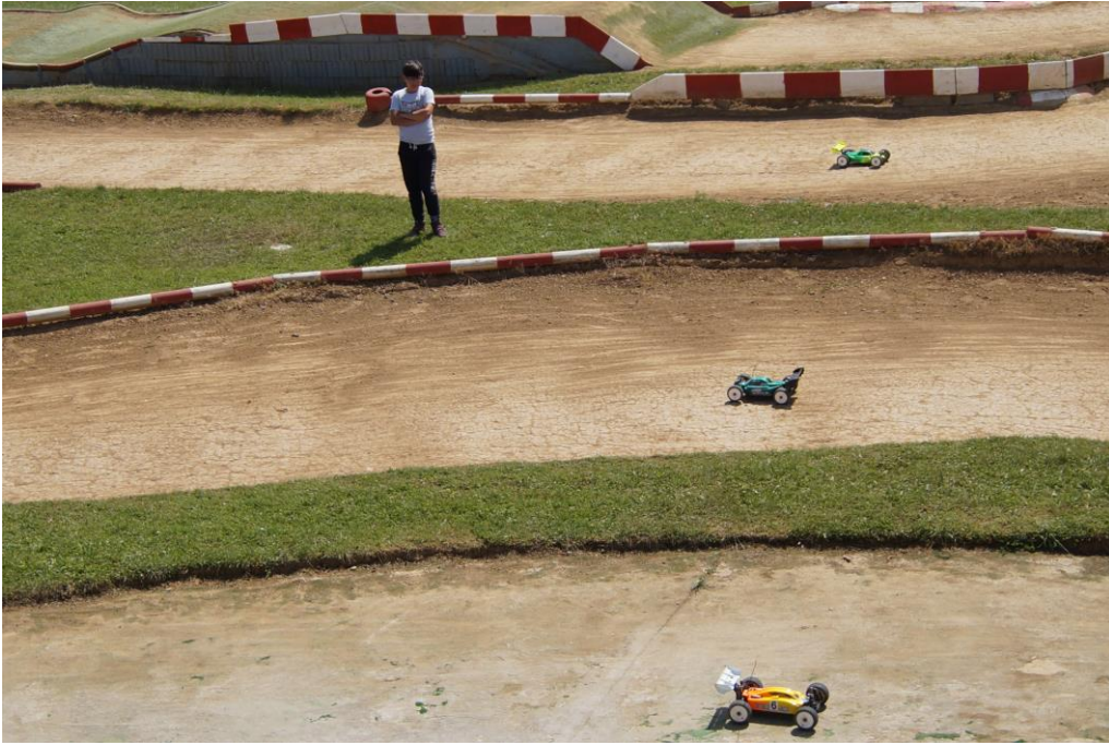
Bild 3: Helferposten falls ein Auto auf dem Dach liegt, und Rennbuggys auf der Strecke